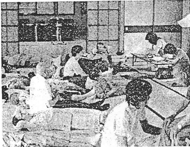
集団で楽しくリハビリに励む参加者たち

そのほか「自分一人だとい甘えてしまうが、みんなで行くいろいろなので楽しい」「みんな同じ病気なので恥ずかしくない」などの意見が大勢を占めた。同教室には最近、脳卒中だけでなく、老人ボケの人も参加しており、機能回復へ向け交流の輪が広がっている。